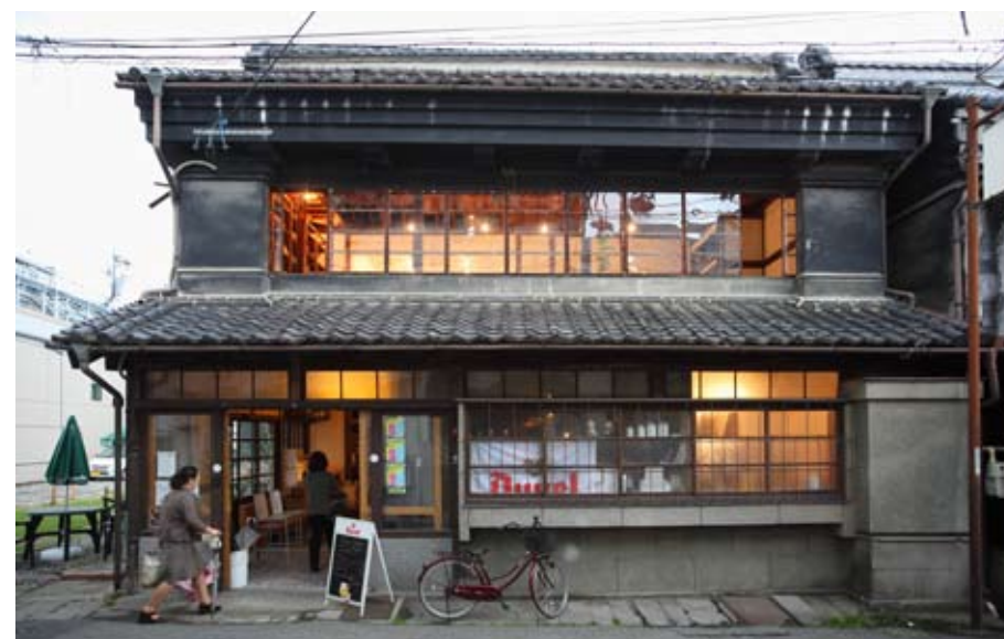
torinoco 外観 (2 階)。玄関入り、右手の階段からお上がりください