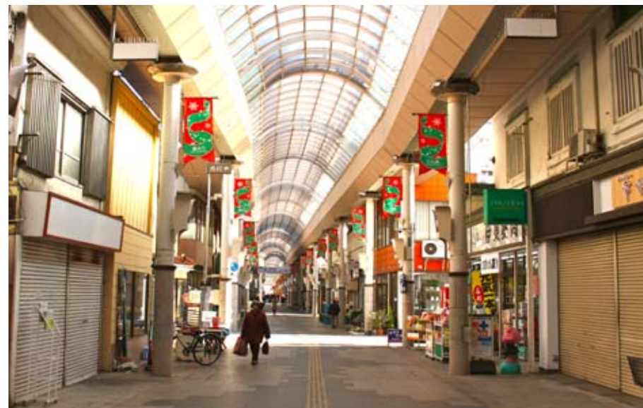
権堂アーケードにある『資生堂・伊東薬局』と『タケダ生花店』の間を曲がりすぐ